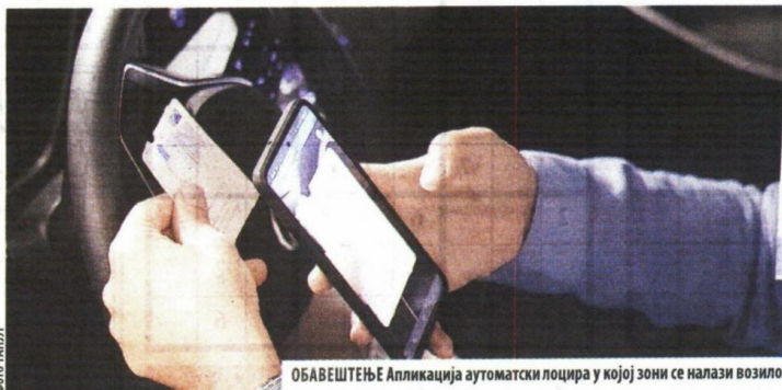
ОБАВЕШТЕЊЕ Апликација аутоматски лоцира у којој зони се налази возило

контакта са инкасантима. Потребно је само скенирати картицу, коју корисници преузимају на уласку у паркиралиште и плате онлајн директно из апликације.